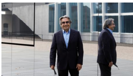
Riccardo Muti

La settima edizione di Riccardo Muti Italian Opera Academy si svolge per la prima volta in collaborazione con la Fondazione Prada dal 4 al 15 dicembre 2021, presso la sede milanese della Fondazione: il pubblico può partecipare all'intero percorso di prove e concerti focalizzato sul Nabucco , diretto dal Maestro Riccardo Muti.